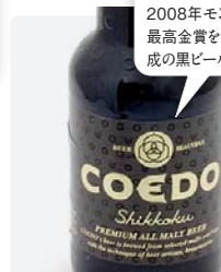
COEDOビール「漆黒」 333ml ¥840

5種類の味が選べる「COEDOビール」。こちらは2008年モンドセレクションで最高金賞を受賞した、長期熟成の黒ビール「漆黒」です。