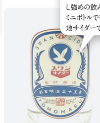
スワンミニ 95ml ¥577

昭和初期から使いはじめたというスワンのマーク。炭酸が少し強めの飲み口も当時のまま。ミニボトルで復刻した、佐賀の地サイダーです。