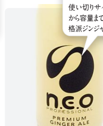
ネオジンジャーエール 95ml ¥577

プロのバーテンダーと共同開発。カクテルで使用するために使い切りサイズにするなど、味から容量までデザインされた本格派ジンジャーエールです。