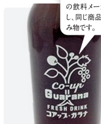
コアップガラナ 230ml ¥525

1950年代にコーラが輸入されることへの対抗策として全国の飲料メーカーが一致団結し、同じ商品名で発売した飲み物です。