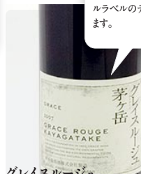
グレイスルージュ グラス ¥840 芽ヶ岳 ハーフボトル ¥2,310

程よく渋みのある味わいが特徴です。原研哉さんによるボトルラベルのデザインも目を引きます。