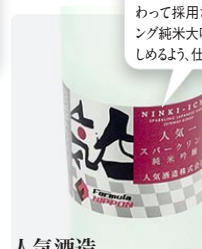
人気酒造 スパークリング純米吟醸 グラス ¥735

フォーミュラ・ニッポンの表彰式で、スパークリングワインに代わって採用された「スパークリング純米吟醸」を、手頃に楽しめるよう、仕上げたものです。