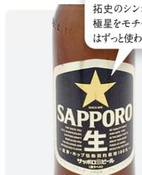
サッポロ黒ラベル 200ml ¥735

1877年にはじめて「札幌ビール」として販売、それ以来、開拓史のシンボルとしてこの北極星をモチーフにしたマークはずっと使われています。