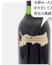
北条ワイン グラス ¥735 ハーフボトル ¥1,890

砂丘農業の盛んな北条砂丘でつくられた赤ワインです。飲み終わった後に、正面から瓶をかざしてみると瓶の中央に砂丘の風紋が見えます。