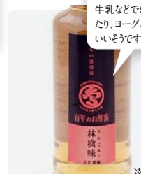
百年のお酢蜜 ※ソーダ割り ¥630

飲むお酢「百年のお酢蜜(おすみつ)」です。水や炭酸水、牛乳などで5倍くらいうすめたり、ヨーグルトに少しかけてもおいしいですよ。