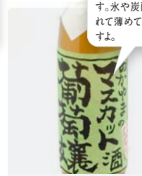
マスカット酒葡萄嬢 グラス ¥735

桃と岡山の地酒とが一緒になった、甘口のリキュールです。水や炭酸水をたっぷり入れて薄めて飲むとおいしいですよ。