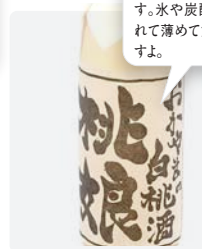
白桃酒桃娘 グラス ¥735

桃と岡山の地酒とが一緒になった、甘口のリキュールです。水や炭酸水をたっぷり入れて薄めて飲むとおいしいですよ。