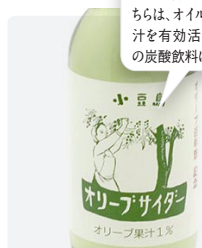
オリーブサイダー 200ml ¥630

オリーブの実から絞れるオイルは実の約2割しかありません。こちらは、オイルを絞った後の果汁を有効活用し、甘さ控えめの炭酸飲料に仕上げました。